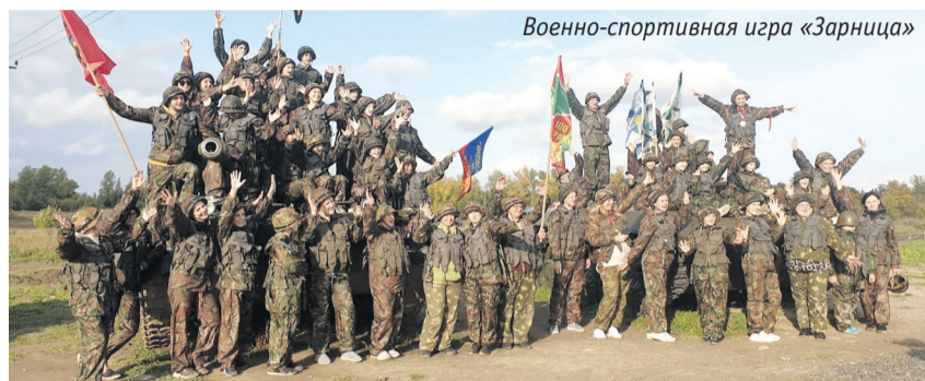
Военно-спортивная игра «Зарница»

А 21 октября на территории округа прошел экологический квест для всей семьи «Построй завод переработки пластиковых бутылок». Участники квеста создавали дизайн экоплаката, узнавали, какие природные ресурсы нужны для производства упаковки и как переработка помогает их экономить. Он прошел в рамках программы экологического просвещения МО Большая Охта в сотрудничестве с экодвижением «Раздельный Сбор».