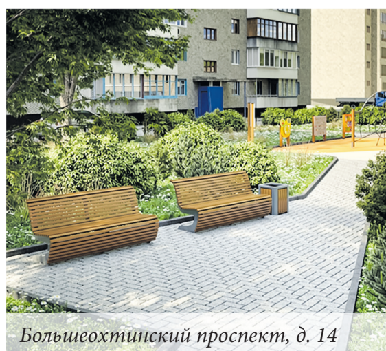
Большеохтинский проспект, д. 14