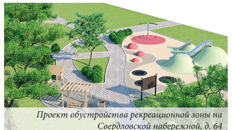
Проект обустройства рекреационной зоны на Свердловской набережной, д. 64