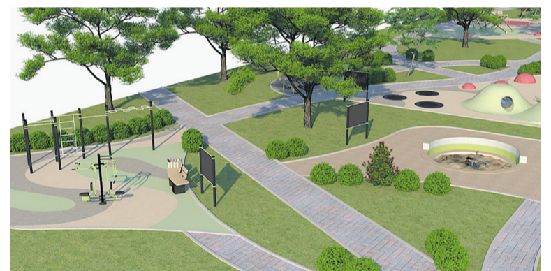
Проект обустройства рекреационной зоны на Свердловской набережной, д. 64

Правительством Санкт-Петербурга выделено финансирование в сумме