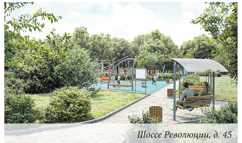
Шоссе Революции, д. 45