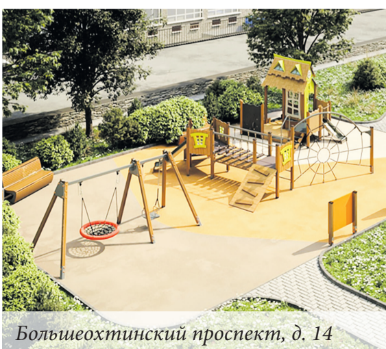
Большеохтинский проспект, д. 14