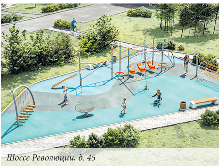
Шоссе Революции, д. 45

Все проекты находятся на разных этапах реализации. Окончание работ планируется до 15 октября текущего года.