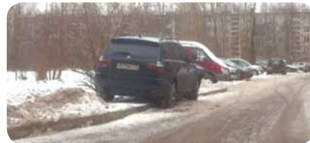
Не паркуйтесь на газонах