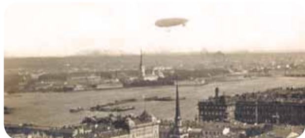
Защитники родного города