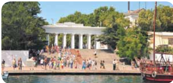
Поездки в Севастополь