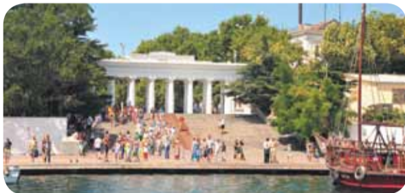
Поездки в Севастополь